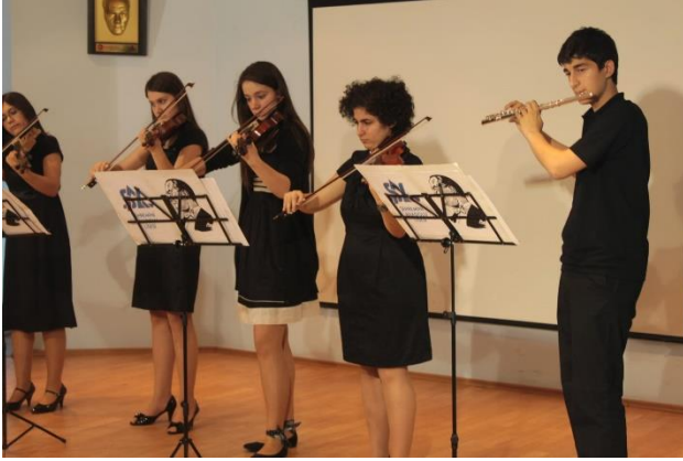
KORO-ORKESTRA ÇALIŞMALARINI İLE